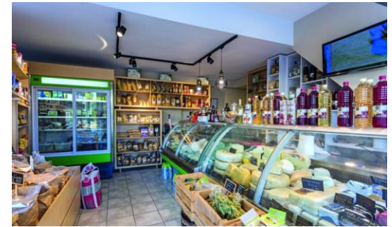
Παντοπωλείο με παραδοσιακά προϊόντα