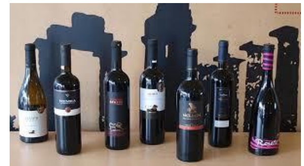
Γνωριμία με τα κρασιά της περιοχής