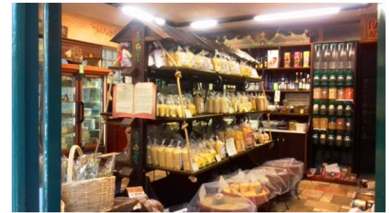
Παντοπωλείο με σπιτικά ζυμαρικά